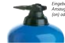
Eingebauter By-Pass-Ansaugsystem eingeschaltet (on) oder ausgeschaltet (off).

Die Optionen ermöglichen es, den Dosatron optimal an den Bedarf anzupassen. Deren Notwendigkeit wird mit der Unterstützung unserer technischen Abteilung festgelegt.