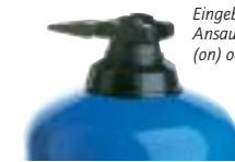
Eingebauter By-Pass-Ansaugsystem eingeschaltet (on) oder ausgeschaltet (off).

Die Optionen ermöglichen es, den Dosatron optimal an den Bedarf anzupassen. Deren Notwendigkeit wird mit der Unterstützung unserer technischen Abteilung festgelegt.