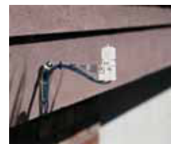
Arbeitet auch mit Wettersensoren